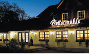
Hotel Pfeffermühle Frankfurter Straße 261 57074 Siegen