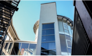
Berufsbildungszentrum (bbz) der IHK Siegen Birlenbacher Hütte 10 57078 Siegen