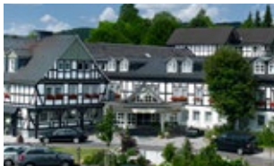
Haus Platte Repetalstraße 219 57439 Attendorn