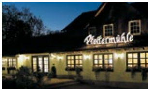
Hotel Pfeffermühle Frankfurter Straße 261 57074 Siegen