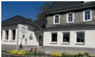
Rumilingene Haus Raumländer Straße 2 57319 Bad Berleburg

Mit unserem Seminarangebot decken wir ein breites Spektrum an Fach- und Themengebieten ab. Profitieren Sie von dem aktuellen Wissen und den fachlichen Erfahrungen unserer Referenten und Trainer. Wir freuen uns, Sie bei uns zu begrüßen!