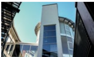
Berufsbildungszentrum (bbz) der IHK Siegen Birlenbacher Hütte 10 57078 Siegen