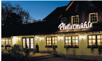
Hotel Pfeffermühle Frankfurter Straße 261 57074 Siegen