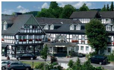
Haus Platte Repetalstraße 219 57439 Attendorn