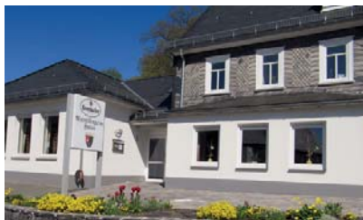
Rumilingene Haus Raumländer Straße 2 57319 Bad Berleburg

Mit unserem Seminarangebot decken wir ein breites Spektrum an Fach- und Themengebieten ab. Profitieren Sie von dem aktuellen Wissen und den fachlichen Erfahrungen unserer Referenten und Trainer. Wir freuen uns, Sie bei uns zu begrüßen!