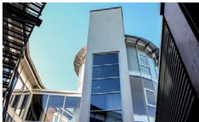
Berufsbildungszentrum (bbz) der IHK Siegen Birlenbacher Hütte 10 57078 Siegen