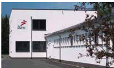
BZW Bildungszentrum Wittgenstein Limburger Straße 74 57319 Bad Berleburg