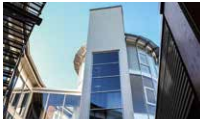
Berufsbildungszentrum (bbz) der IHK Siegen Birlenbacher Hütte 10 57078 Siegen