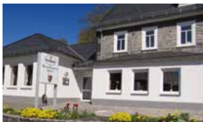
Rumilingene Haus Raumländer Straße 2 57319 Bad Berleburg

Sie suchen nach einer individuellen Lösung zum Veranstaltungsort? Sprechen Sie uns gerne an! Wir erstellen Ihnen Angebote zur Durchführung im BZW Bildungszentrum Wittgenstein oder als Inhouse-Lehrgang.