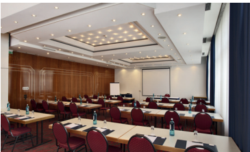
Concorde Hotel Kampenstr. 83 57072 Siegen

Mit unserem Seminarangebot decken wir ein breites Spektrum an Fach- und Themen-gebieten ab. Profitieren Sie von dem aktuellen Wissen und den fachlichen Erfahrungen unserer Referenten und Trainer. Wir freuen uns, Sie bei uns zu begrüßen!