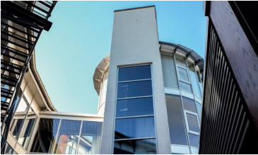
Berufsbildungszentrum (bbz) der IHK Siegen Birlenbacher Hütte 10 57078 Siegen